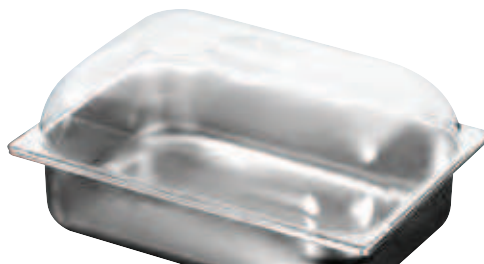
coperchio policarbonato muffola polycarbonate lid mitten dome