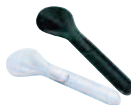
spatola gelato in policarbonato polycarbonate ice-cream spoon