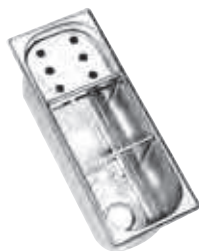
lavaporzionatore singlebody portioner wash