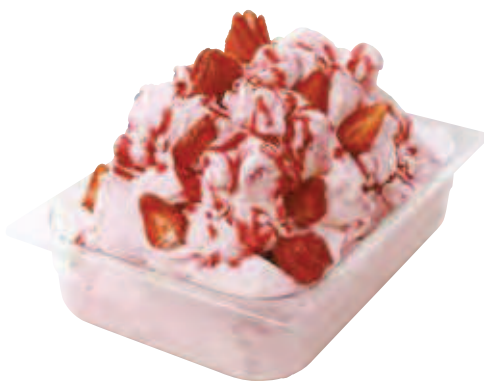
bacinelle gelateria in policarbonato polycarbonate ice-cream pans