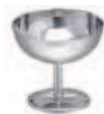
coppa gelato - ice-cream cup