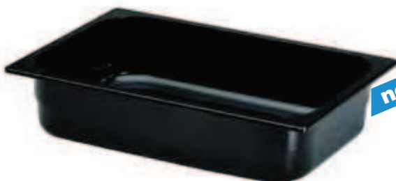
bacinelle gelateria in policarbonato nero black polycarbonate ice-cream pans