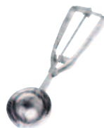
porzionatore gelato ice-cream scoop