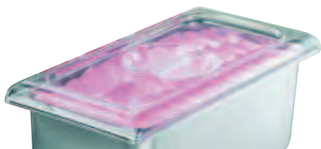
coperchio policarbonato gelateria polycarbonate ice cream lid