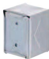
porta tovaglioli - napkin holder